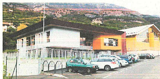
Scuola Primaria Nogaredo