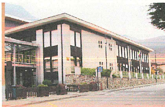
Scuola Primaria Pomarolo