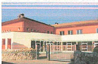
Scuola Primaria Nomi

A seguire un'immagine degli edifici delle nostre cinque scuole ed una breve descrizione.