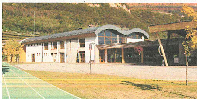
Scuola Primaria Villa Lagarina