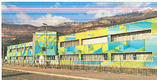
Scuola Secondaria di primo Grado